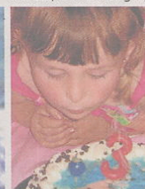
«Zorionak! Un año más. Que con tus 4 años nos des las mismas alegrías. Un musu muy fuerte».