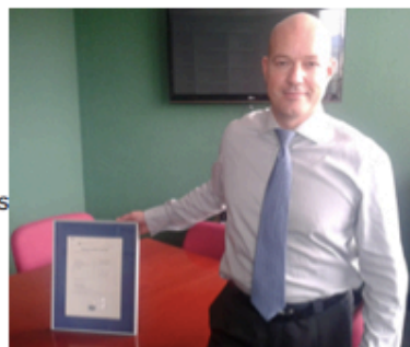
El certificado refuerza la posición de operador de confianza de la compañía

SLP es un operador integral de la cadena logística del transporte marítimo y dispone de dos concesiones en el puerto de Bilbao. La más reciente, que data de diciembre de 2011 y está ubicada en el Muelle AZ-2, cuenta con una superficie de 30.000 metros cuadrados, 9.000 metros cuadrados de zona de maniobra, 300 metros de línea de atraque y 20 metros de calado. A estas infraestructuras hay que sumar las del Muelle Adosado: 42.000 metros cuadrados de superficie, tres almacenes (de 7.000, 6.000 y 4.850 metros cuadrados), gran cantidad de equipos (grúas móviles, palas cargadoras, retrogrúas y retropalas, tolvas y cintas transportadoras).